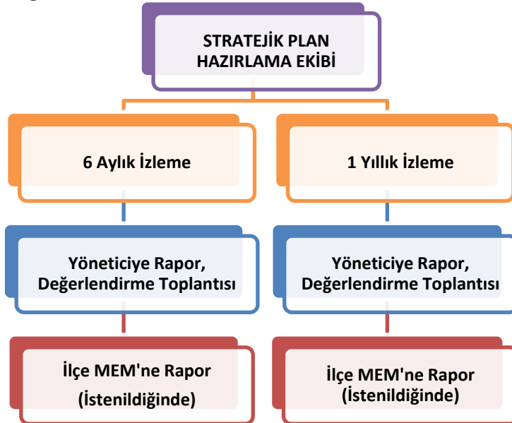
Şekil 2 İzleme ve Değerlendirme Süreci

Müdürlüğümüzün 2019-2023 Stratejik Planı İzleme ve Değerlendirme sürecini ifade eden İzleme ve Değerlendirme Modeli hazırlanmıştır. Okulumuzun Stratejik Plan İzleme-Değerlendirme çalışmaları eğitim-öğretim yılı çalışma takvimi de dikkate alınarak 6 aylık ve 1 yıllık sürelerde gerçekleştirilecektir. 6 aylık sürelerde Okul Müdürüne rapor hazırlanacak ve değerlendirme toplantısı düzenlenecektir. İzleme-değerlendirme raporu, istenildiğinde İlçe Milli Eğitim Müdürlüğüne gönderilecektir.